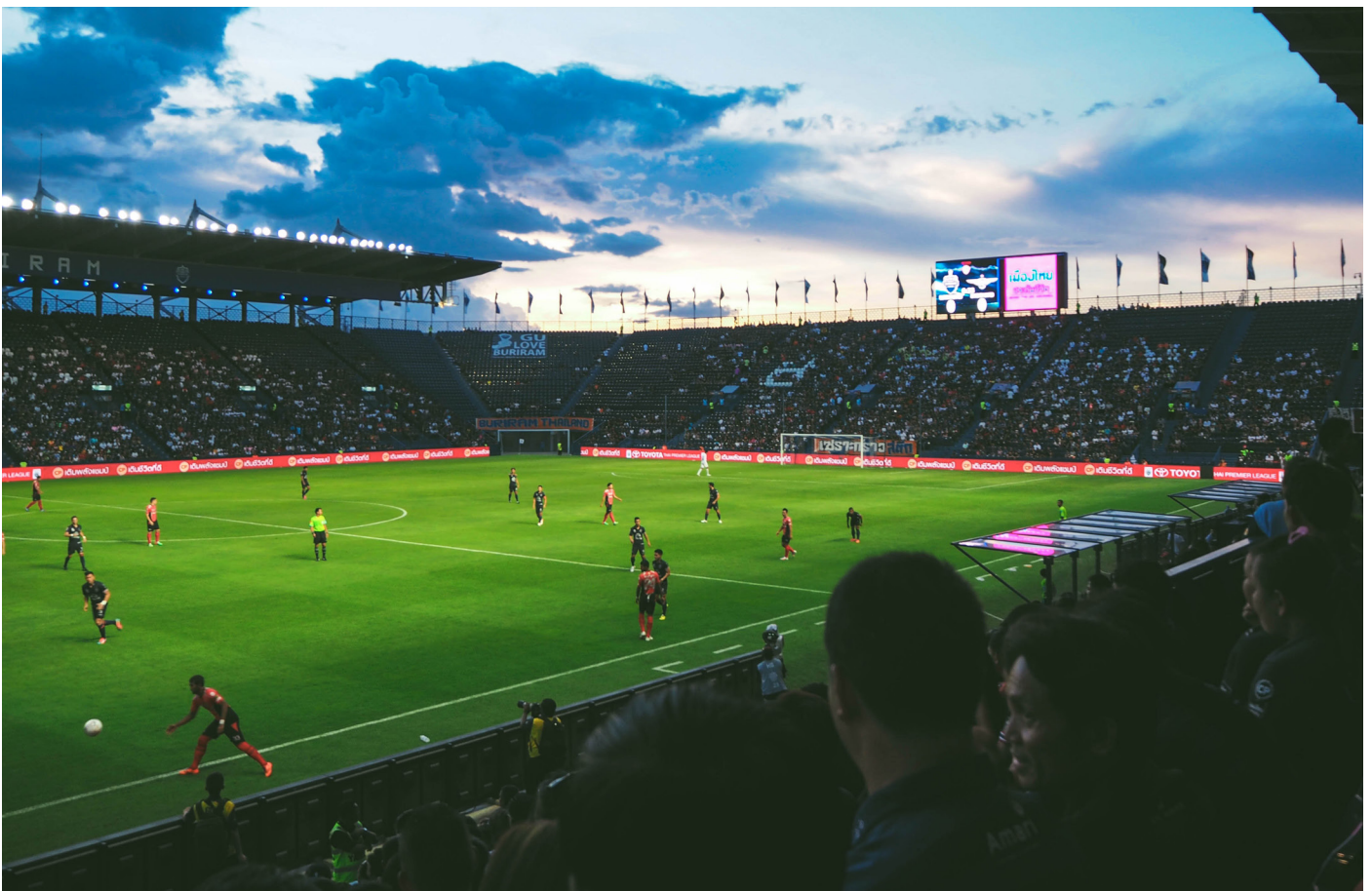
Abbildung. Profifußball https://www.docandcare.com/fussnavigation/kontakt.html

Aufgrund der besonderen Fan-Verein-Bindung leistet die Forschung einen ersten Ansatz zur Wahrnehmung und zum Verständnis der Stakeholdergruppe der Fußballfans bezüglich CSR.