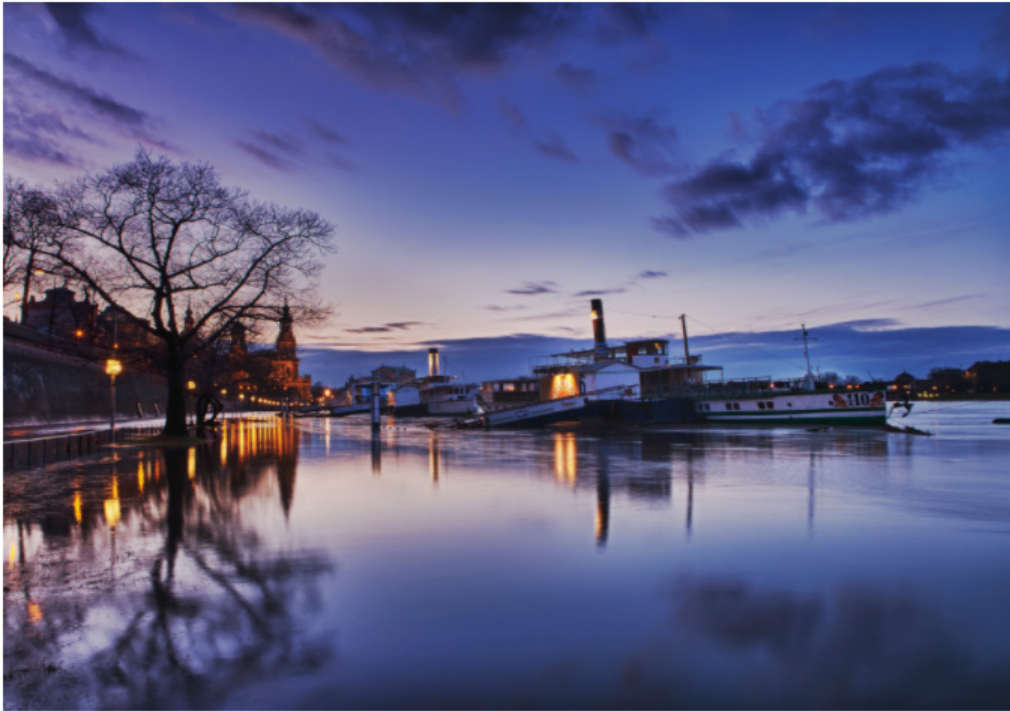
Abbildung. Impressionen vom Tagungsort: http://aow2017.de/frontend/index.php?folder_id=274