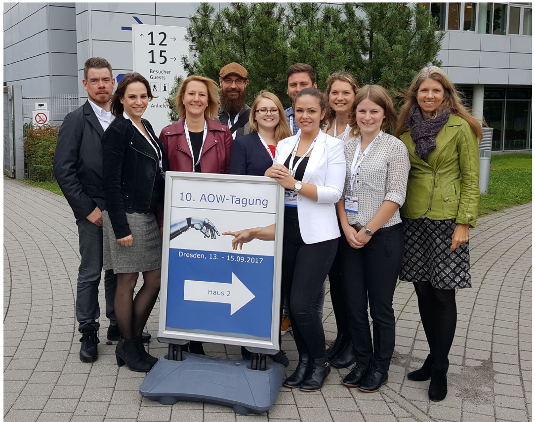
Abbildung. Das WiPs Team auf der AOW Tagung in Dresden