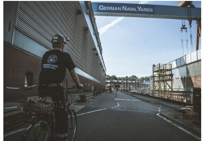
Abbildung. Radfahrer auf einem Werksgelände https://www.schleswig-holstein.de/DE/Fachinhalte/W/weiterbildung/Bilder/arbeiten_gny_2.jpg?__blob=poster&v=1

Die Bewertung, welche Situation in den Fragebogen aufgenommen werden sollte, konnte ich mit Hilfe