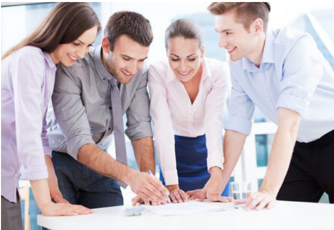
Abbildung. Teamarbeit http://karrierebibel.de/teilzeitarbeit/

Kollektive Orientierung (KO) bedeutet gerne im Team zu arbeiten und Input anderer zu berücksichtigen. Group Potency (GP) ist die Wahrnehmung, als Team diverse Aufgaben erfolgreich zu bewältigen. Perceived Self-Efficacy (PSE) beschreibt das Gefühl von Selbstwirksamkeit, auf Individualebene erfolgreich Einfluss auf eine Aufgabe zu nehmen. Bisher ist bekannt, dass KO und GP interdependente Teamleistung positiv beeinflussen. PSE fördert Individuelleistung. Zusammenhänge zwischen KO, GP und PSE sind bisher nicht eindeutig analysiert. Es soll gezeigt werden, dass Zusammenhänge zwischen KO, GP und PSE bestehen und dass Personen mit hoher KO im Vergleich zu niedriger KO höhere Werte in PSE und GP über die Zeit aufweisen.