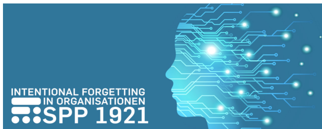
Abbildung. Das SPP1921

Change in Organisationen erfordert häufig das Vergessen alter und das Anwenden neuer Routinen. Das trifft für Individuen und auch für Gruppen zu. Zu den Einflüssen auf intentionales Vergessens in Gruppen wurde jedoch im Vergleich zum individuellen Vergessen bisher wenig geforscht.