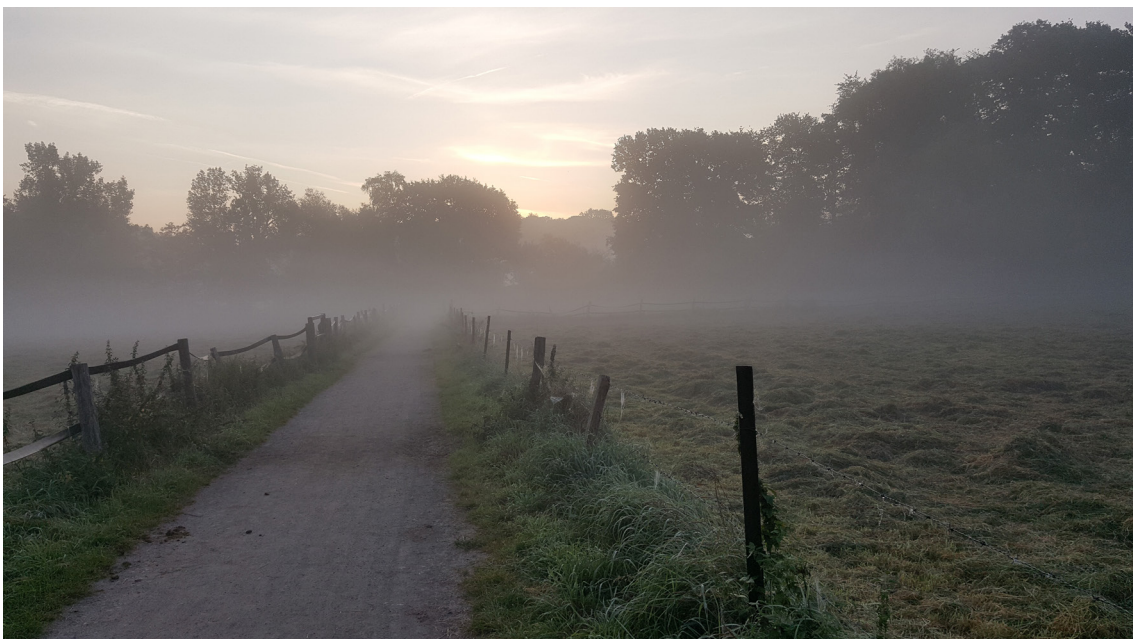
Abbildung, Herbst 2017