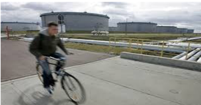
Abbildung. Fahrradfahren auf dem Werksgelände

Zum Beispiel gibt es Regeln zum Fahrradfahren auf dem Werksgelände. Sich nicht daran zu halten, könnte am Zeitdruck liegen. Aus der Kombination je einer Sicherheitsregel und einem Grund eben diese Regel zu missachten, wurden Dilemma-Situationen zusammengestellt. Das Ergebnis aus unserem Beispiel lautet dann „Ich fahre mit dem Rad auf Wegen, auf denen das verboten ist, um nicht zu spät zu meiner Schicht zu kommen.“ Hierbei sind die Grundregeln der Itemkonstruktion zu beachten: beispielsweise die sprachliche Verständlichkeit und die Eindeutigkeit. Ergebnis waren 42 Dilemma-Situationen, die den Umfang eines Fragebogens überschritten. Daher musste ich entscheiden, welche Dilemma-Situation beibehalten werden konnten, die sich besonders eignen.