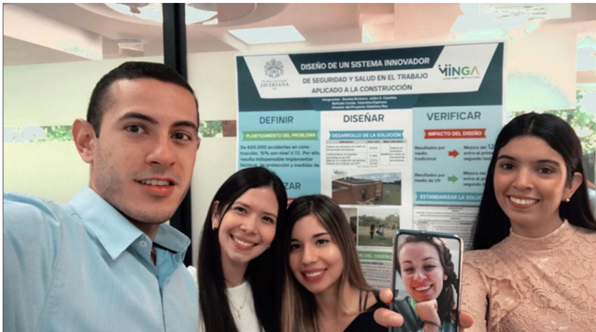
Figure: The authors presenting their study on the conference day