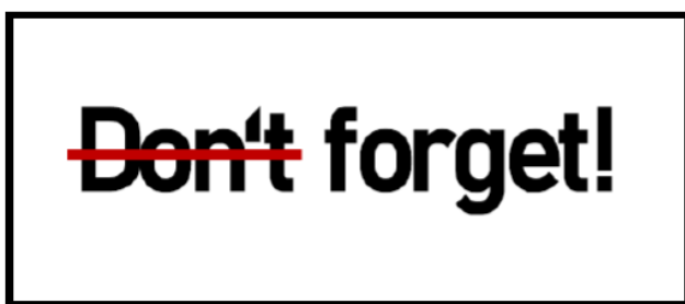
Abbildung: Bei Veränderungen wirkt sich das intentionale Vergessen veralteter Prozesse förderlich auf die Anpassung an das Neue aus

Veränderungen scheinen kognitive Fähigkeiten also von besonderer Relevanz zu sein. Außerdem postulieren Pulakos et al. (2000) in ihrer Taxonomie, dass unter anderem das kreative Problemlösen und das Erlernen von Arbeitsaufgaben, Technologien und Prozeduren als Dimensionen adaptiver Leistung angesehen werden können. Dies unterstreicht ebenfalls die Bedeutung kognitiver Fähigkeiten hinsichtlich der Anpassungsleistung.