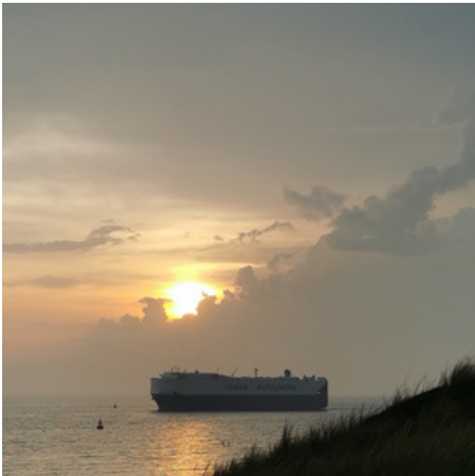
Abbildung: Sozio-technische Navigationssysteme gewähren auch bei der immer weiter steigenden Komplexität in der modernen Maritimenindustrie Sicherheit, solange der Faktor Mensch trotz steigender Automatisierung nicht in Vergessenheit gerät.

Seit Beginn des ENHANCE-Projekts im Jahr 2019 hat das RUB-Team eine wichtige Rolle beim Knowledge Sharing Management inne (KSM). Das Ziel des ENHANCE-Projekts ist die Etablierung wirksamer Trainings- und Beurteilungsinstrumente bezüglich der zunehmenden sozio-technischen Interaktionen innerhalb der maritimen Industrie und der Prozessindustrie. Um dieses Ziel zu erreichen sind die Aufgaben des KSM vor allem unterstützend. Zum einen unterstützen wir das Wissensaustauschprogramm und monitoren dieses. Zum anderen koordinieren wir den Austausch von Ergebnissen, Erfahrungen und erworbenen Wissen zwischen den beteiligten Forschungseinrichtungen und Unternehmen. Dies dient dazu, die potenziellen Synergien zwischen den beteiligten wissenschaftlichen Disziplinen auszuschöpfen.