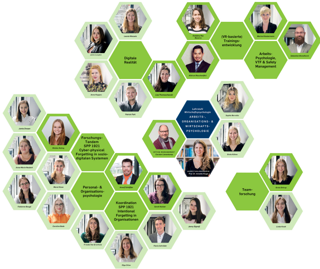
Abbildung: Das Team des Lehrstuhls Arbeits-, Organisations- und Wirtschaftspsychologie