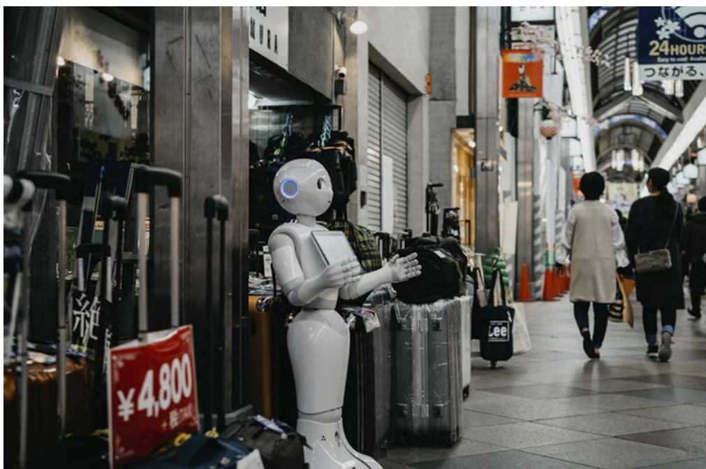
Kyoto Prefecture, Japan, Robot in Shopping Mall in Ky

Tausch A, Kluge A and Adolph L (2020). Psychological Effects of the Allocation Process in Human–Robot Interaction – A Model for Research on ad hoc Task Allocation. Front. Psychol. 11:564672. doi: 10.3389/fpsyg.2020.564672