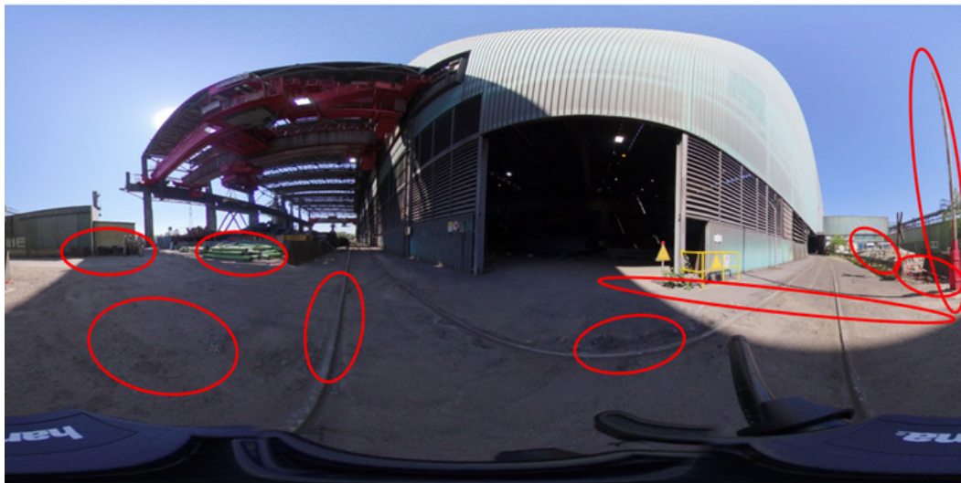
Abbildung: Aufnahme 5 mit markierten, identifizierten Gefahrenstellen

Trainings- und Sensibilisierungsmaßnahmen unbedingt beachtet werden sollte. Möglichkeiten VR-Sickness zu reduzieren könnte zum Beispiel eine gut strukturierte Eingewöhnung sein, nur die nötigste Zeit in einer VE zu verbringen oder die möglichst kohärente Einbindung mehrerer Sinne.