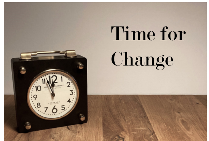
Abbildung: Anpassung an veränderte Arbeitsprozesse erfordert intentionales Vergessen

flusst. So hat beispielsweise die Arbeitsumgebung einen Einfluss auf die Arbeitsleistung (z.B. Jayaweera, 2015; Kahya, 2007), aber auch die Gewissenhaftigkeit als Persönlichkeitsfaktor hängt mit der Leistung am Arbeitsplatz zusammen (Barrick & Mount, 1991). Besonders gut zur Vorhersage der Arbeitsleistung eignen sich die kognitiven Fähigkeiten einer Person (Schmidt & Hunter, 2004). Es konnte gezeigt werden, dass kognitive Fähigkeiten die Arbeitsleistung valide vorhersagen (z. B. Hülsheger et al., 2007; Schmidt & Hunter, 2004). Neben der allgemeinen Intelligenz sind allerdings auch spezifische kognitive Fähigkeiten wie z.B. verbale oder räumliche Fähigkeiten von Bedeutung (Kell & Lang, 2017).